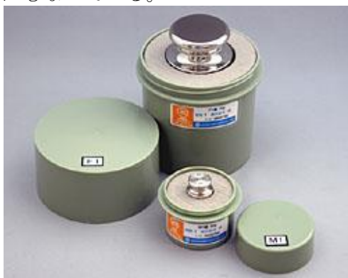
分銅上面のマーキング

2.4 項で示したように、規格適合の表記は格納容器に付さなければならない。弊社では、図 2 に示すようなラベルを作成して格納容器に貼っている。分銅の上面には、公称値を示す数字（図では 2）と共に識別記号（図では 01）がマーキングされる。この識別記号が格納容器との合い番号になり、規格適合であることを表す。なお、この識別記号はユーザーの任意の文字（字数制限あり）で付すことが可能であり、器物管理の一助にもなっている。