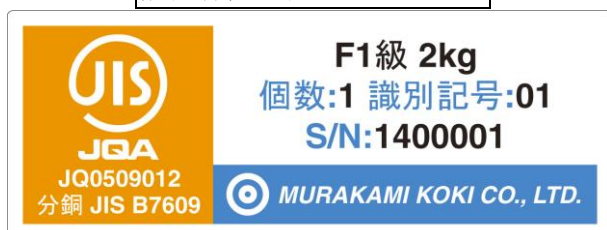
図 2 JIS マークの表記

JIS マークは工場出荷時の適合性表明（品質及び検査工程のトレーサビリティ）をするもので、その状態を永遠に保証するものではない。また、質量検査結果を記した証明書等の添付もない。分銅の協定質量や不確かさを含むトレーサビリティの証明には、 JCSS 校正証明書 の添付が必要不可欠となる。